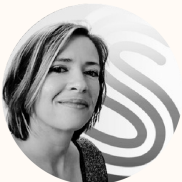
RUBISENS SERVICE DIGITAL - INTELLIGENCE COLLECTIVE

Sur ce stand : découvrez les énergies de votre thème natal